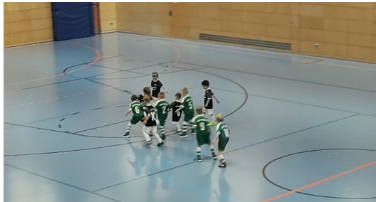
(Hallenkreismeisterschaft der U7)

Alle Mannschaften der SG Schwarzenlohe wechselten vom Feld mittlerweile in die Halle und bereiten sich auf die Hallenkreismeisterschaft und Futsal-Liga vor, bzw. spielen diese schon.