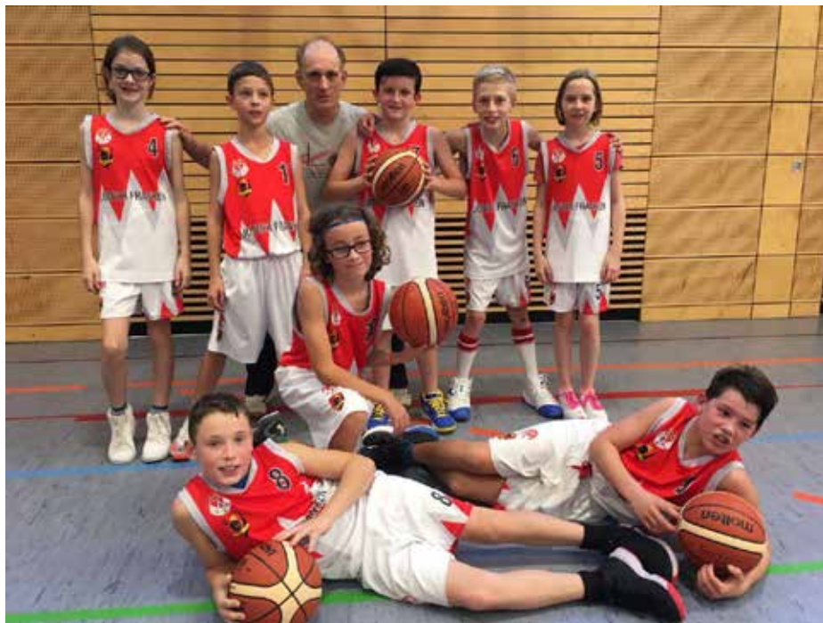
Die U12 nach dem Turniersieg in Feucht

Die U12 spielt bisher eine starke Saison, nur der TSV Nürnberg war eine Nummer zu groß. Überraschend konnte das Team ein gut besetztes Turnier in Feucht gewinnen. Die technisch starken Kids können bisher überzeugen und werden sich zu Saisonende im oberen Tabellendrittel wiederfinden.