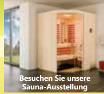
Besuchen Sie unsere Sauna-Ausstellung