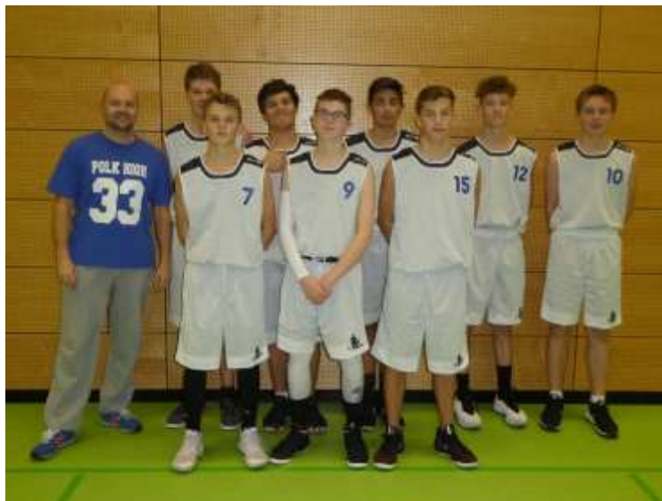
Die U16-männlich des SCG

Ungeschlagen ist bisher die U16. Der Verlust wichtiger Spieler, die aus „Altersgründen“ nicht mehr spielberechtigt sind, konnte überraschend gut kompensiert werden. Spielerisch kann kein Team der Liga mit dem SCG mithalten. Nur das körperlich starke Team aus Weißenburg könnte dem SCG gefährlich werden.