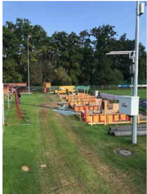
Jetzt warten wir auf die Betonpumpe...