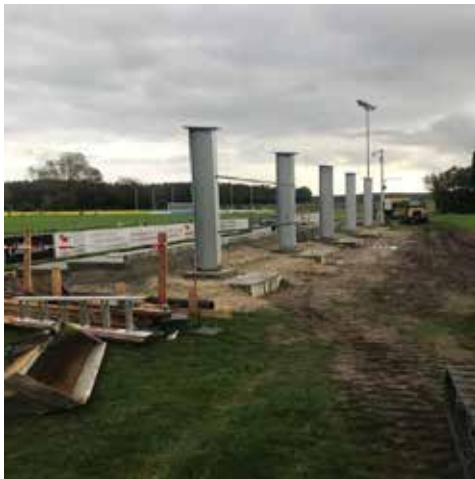
Alle Steher sind einbetoniert....