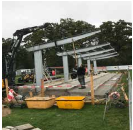
...die Dachkonstruktion ist fast fertig