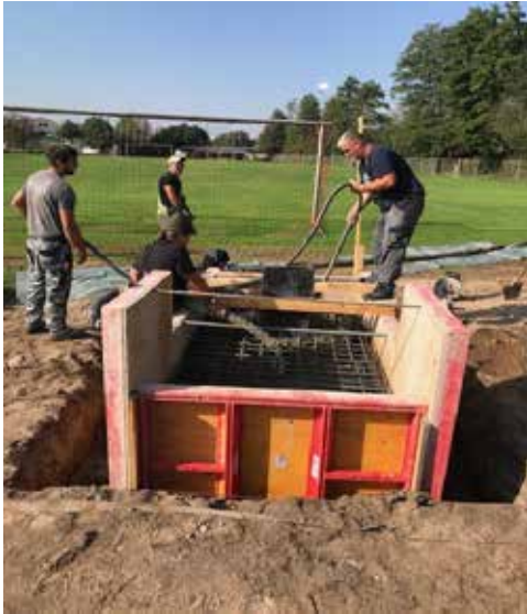
Der Beton fließt...