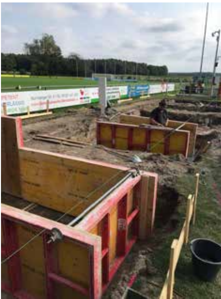
Einschalen für die 4 Fundamente...