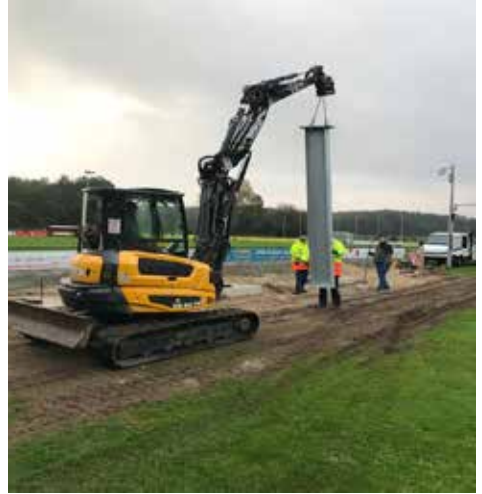
...die Steher werden eingesetzt – je ca. 500kg