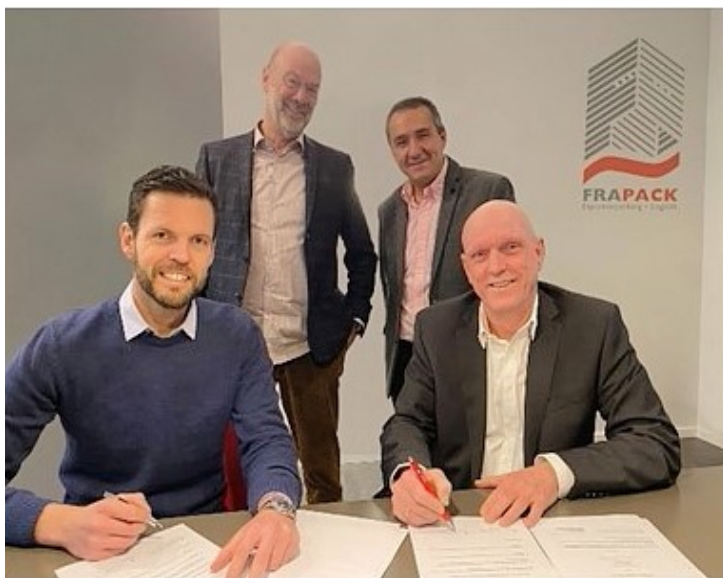
Feierliche Vertragsunterzeichnung am 3.12.2020